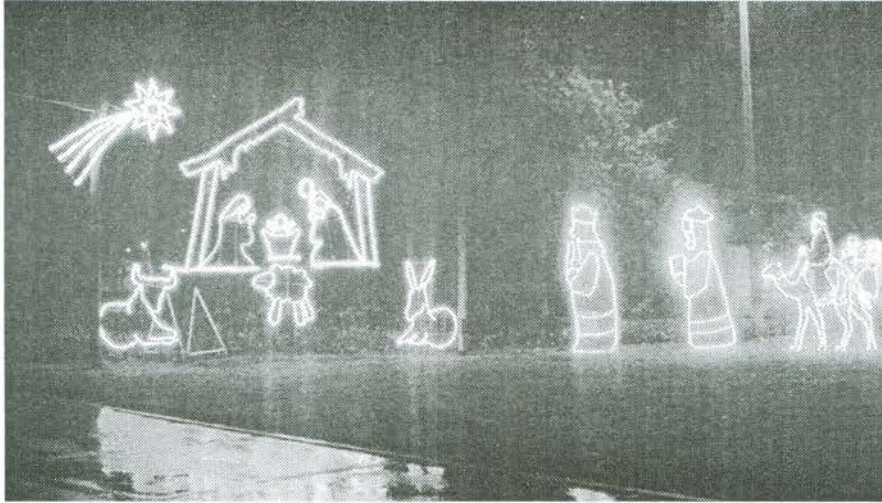
Pesebre en el Pozo de Donato