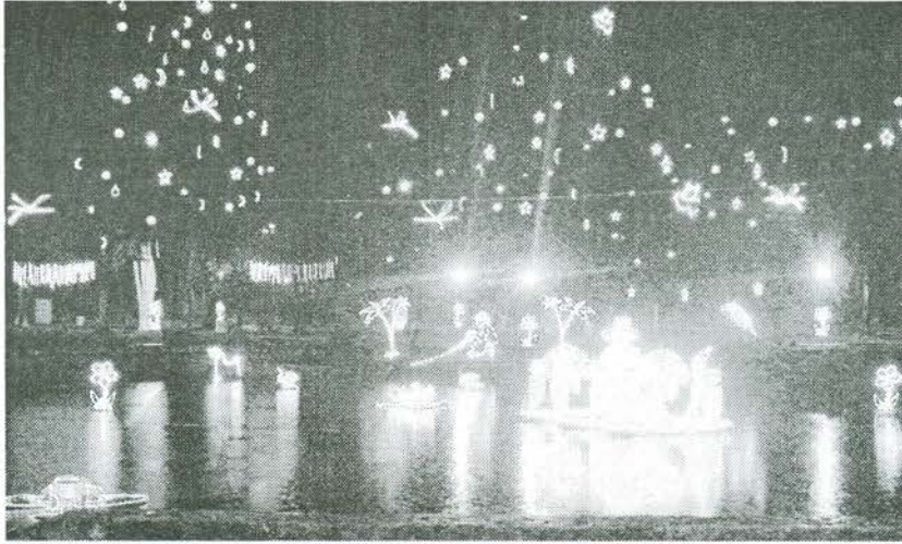
Iluminación decembrina del Pozo de Donato

Analice y describa oralmente las siguientes imágenes: