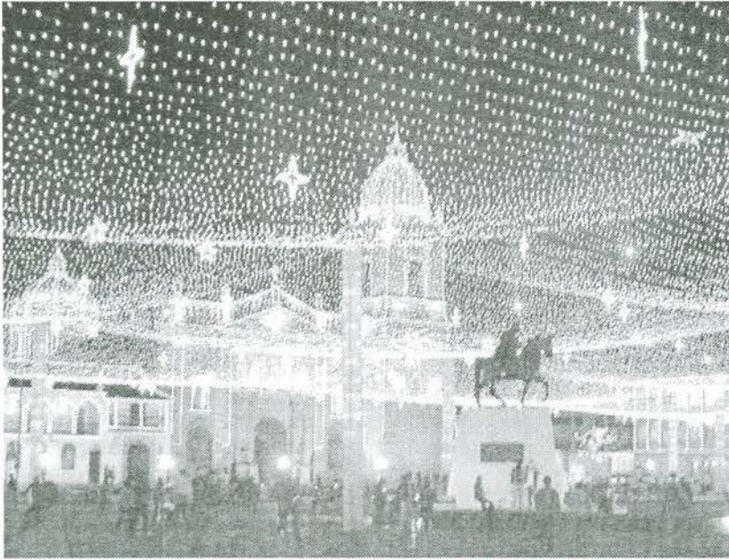
Iluminación navideña de la Plaza de Bolívar

La arcaica y milenaria Hunza fue un asentamiento de la primera cultura muisca cacicazgo de Zaques. Su nombre deriva del chibcha, nombre del cacique mítico de la ciudad de (Hunzahúa) Tunja, que significa “varón prudente”. El capitán Gonzalo Suárez Rendón fundó esta ciudad el 6 de agosto de 1539. Años más tarde, Carlos V, Rey de España, le otorgó el título de ciudad de Tunja, capital de Provincia del Nuevo Reino de Granada. Tras nuestra independencia, en el siglo XIX, el libertador Simón Bolívar la denominó “Cuna y taller de la Libertad”.