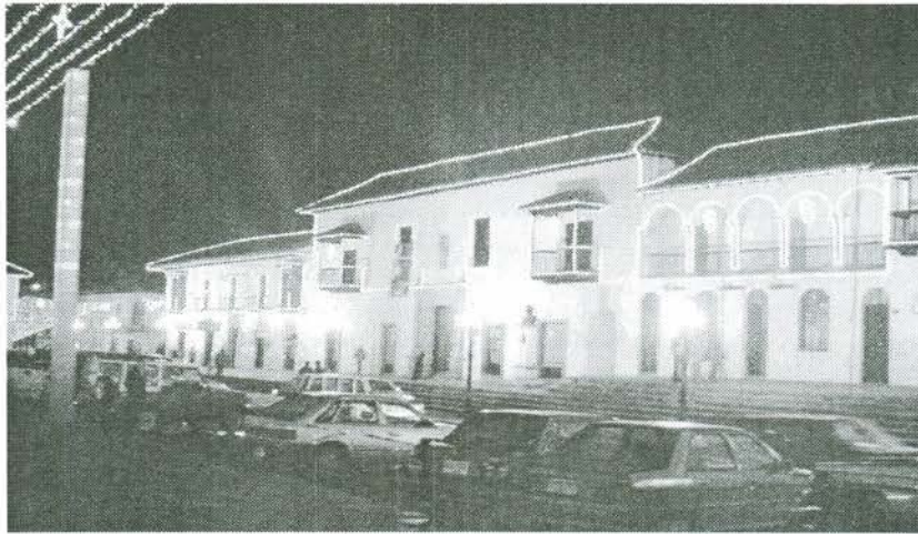
Iluminación de la Casa del Fundador de Tunja