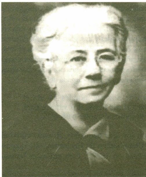
Rosario Vera Peñaloza (Educatora; 1873–1950)