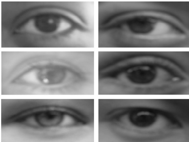
“Una Mirada a la Investigación” 4 Autora: María Fernanda Riaño

La investigación , como un fenómeno cultural, atraviesa diversos campos de pensamiento y acción. Después de realizar algunas pruebas piloto con los instrumentos de recolección de información (entrevistas a profundidad semiestructuradas) hemos planteado los siguientes campos y direcciones para orientar el estudio: el de la actitud, el de la práctica y el de la política. La actitud , busca develar las formas en que la comunidad concibe la investigación a través de una categoría de forma de vida, como un proceso intrínseco a la naturaleza humana, la practica hace relación a la naturaleza de las motivaciones y de las percepciones colectivas e individuales de la dinámica emergente al trabajo de los grupos de investigación, y la tercera: la política , estudiada a través del contraste de las políticas que la universidad viene implementando con la práctica y valoración que cada escuela le otorga a la investigación dentro de sus planes curriculares.