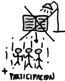
¿Cómo le gustaría que fuera la investigación? Dibujo estudiante UPTC 2009 Duitama La investigación: los colores.

Es así, que contemplamos que los sentidos que toma la concepción de la investigación se encuentran estrechamente ligados a las vivencias que se manifiestan desde la cotidianidad universitaria, donde grupos de investigación, semilleros, estudiantes, van creando, fortaleciendo o desmitificando las ideas que le dan vida y determinan la disposición de estudiantes o docentes a involucrarse y hacer parte activa y dinamizadora de la cultura investigadora, por lo tanto, son estos encuentros los que le proporcionan color y organicidad.