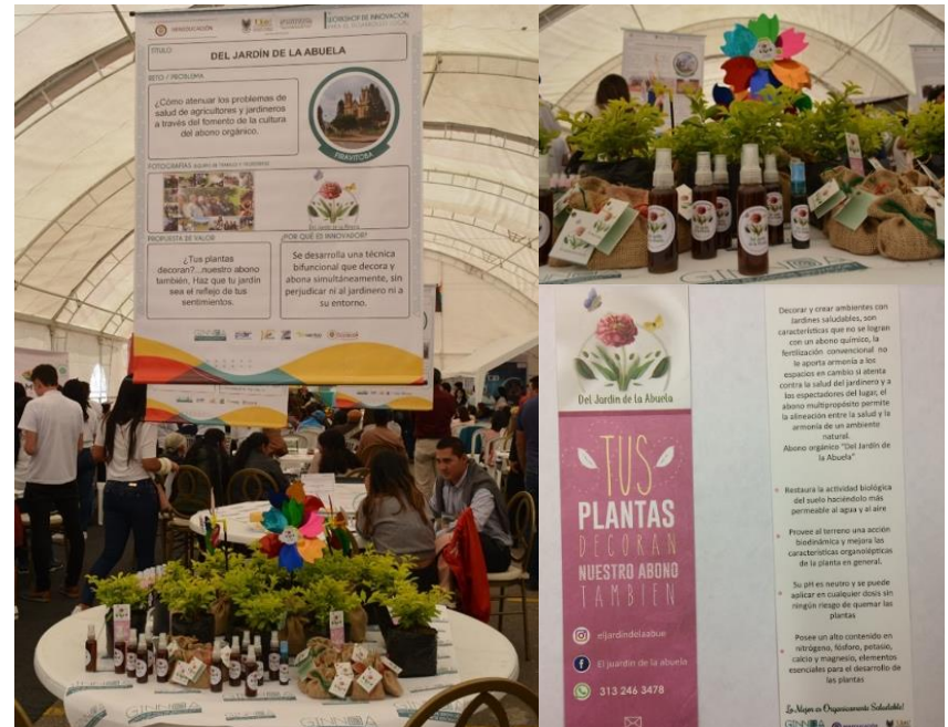
Foto: Tunja, noviembre 22 de 2018. Resultados finales del proyecto: “Jardín de la abuela” en las instalaciones del Primer Workshop de Innovación para el Desarrollo local.

Oportunidad: La solución es el diseño y construcción de una línea de artefactos decorativos para jardines con una “estaca” que contendrá abono orgánico producido directamente en las huertas caseras del municipio de Boyacá.