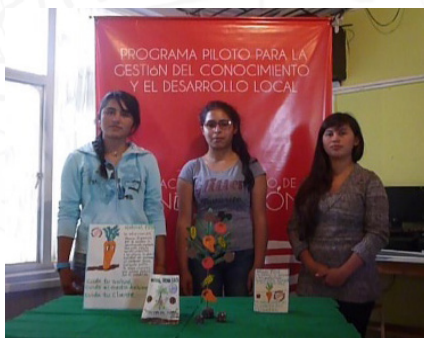
Foto: Municipio de Firavitoba, Agosto 25 de 2018. Beneficiarios del programa, presentando el proyecto Jardín de la Abuela

Reto: ¿Cómo fertilizar los jardines y huertas con productos decorativos y llamativos?