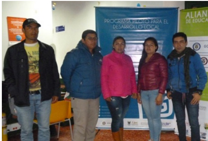
Foto: Municipio de Firavitoba. Agosto 30 de 2018. Beneficiarios del programa, presentando el proyecto Vitrina Campesina.

Firavitoba, Vitrina Campesina, pretende ofrecer la oportunidad de comercialización de productos agrícolas, artesanales y turísticos de pequeños y medianos productores conectando los productos con el cliente final a través de una plataforma virtual con acceso al mercado y a la “carreta”, la vitrina campesina física que divulgaría en ferias y mercados campesinos en Bogotá inicialmente.