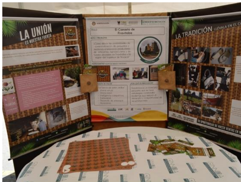
Foto: Tunja, noviembre 22 de 2018. Departamento de Comunicaciones UPTC . Resultados del proyecto "Vitrina Campesina – El Canasto". En el Primer Workshop de Innovación para el desarrollo local.

Consideramos que el reconocimiento territorial permite garantizar productos autóctonos excelentes, dirigidos a un segmento de cliente que valora las tradiciones ancestrales y el valor de la producción del campo.