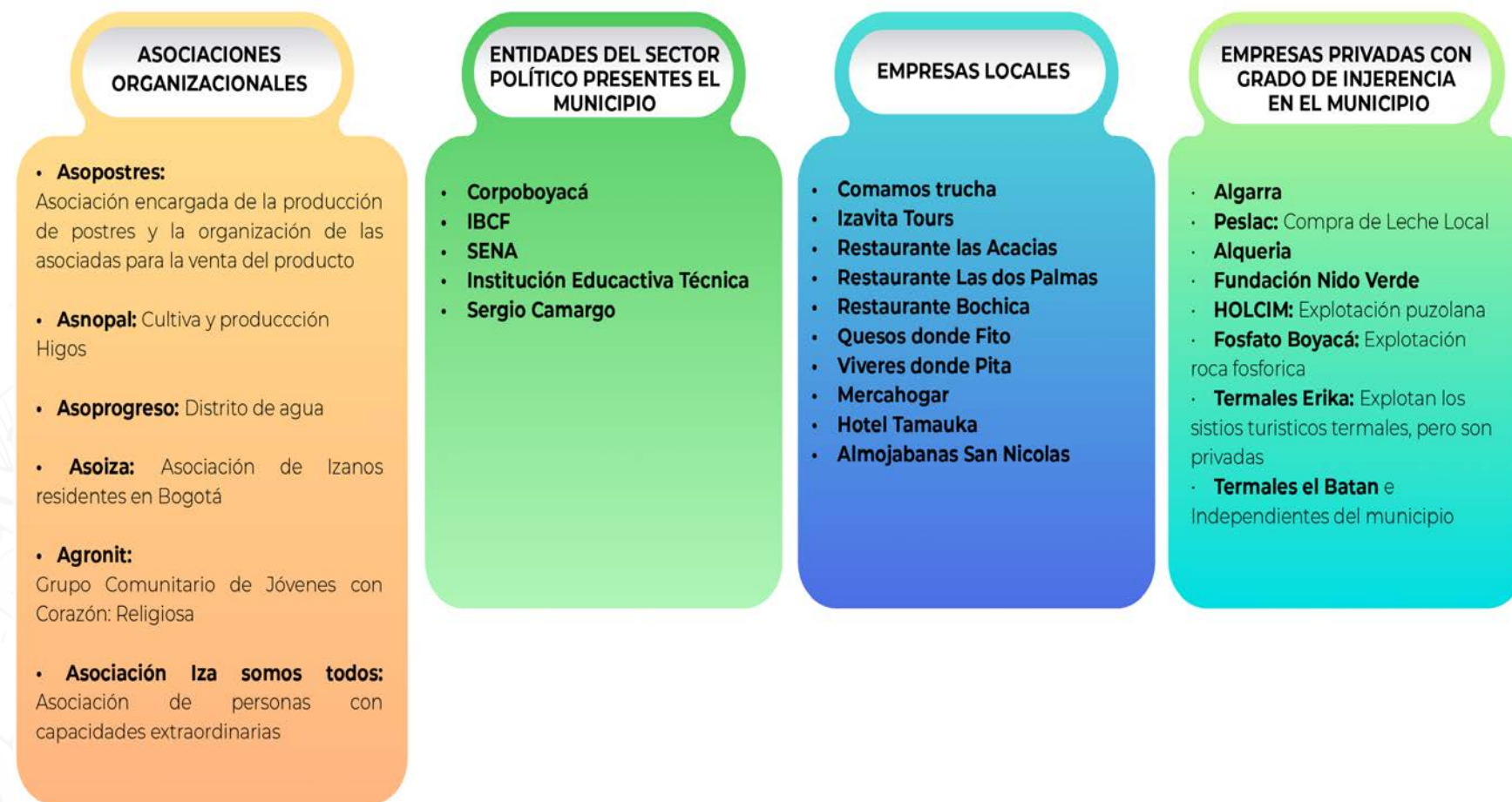
Figura 8. Instituciones presentes en el municipio de Iza.

Las Instituciones presentes en el municipio de Iza son: