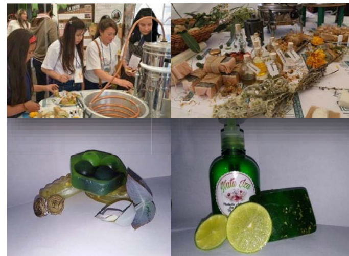
Foto: Tunja, 22 de noviembre de 2019. Resultado final del proyecto: "Natulza". Departamento de Comunicaciones UPTC. En las instalaciones del Primer Workshop de Innovación para el Desarrollo Local.

Producto: Extracción de las esencias e hidrolatos, permiten ser integrados a la elaboración de jabones orgánicos como un insumo propio con su uso aromático, terapéutico y medicinal y poder transformar estas materias primas de manera artesanal. Para la producción de los jabones son realizados con las esencias y extractos del proceso, por lo cual se garantiza que sean orgánicos.