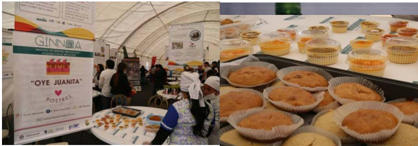
Foto: Tunja, 22 de noviembre de 2019. Resultado final del proyecto: "Postres Oye Juanita". En las instalaciones del Primer Workshop de Innovación para el Desarrollo Local.

Oportunidad: La dueña de la idea, trabaja en la plazoleta de postres por ende conoce el tipo de clientes que visitan el municipios para degustar este producto, por esta razón, considera que ofrecer este postre, permite atender las necesidades de las personas con algún tipo de restricciones alimentarias.