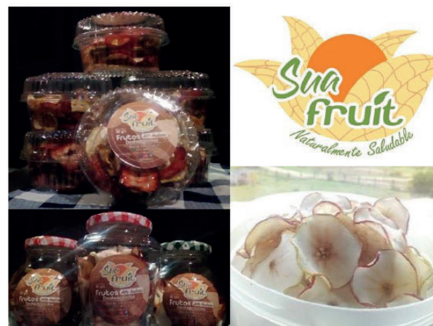
Foto: Tunja, 22 de noviembre de 2019. Resultado final del proyecto: "Bisutería con semillas naturales". Departamento de Comunicaciones UPTC. En las instalaciones del Primer Workshop de Innovación para el Desarrollo Local.

Oportunidad: Aportar un producto a los estilos de vida saludable por medio de energía limpia utilizando como materia prima la producción frutal local.