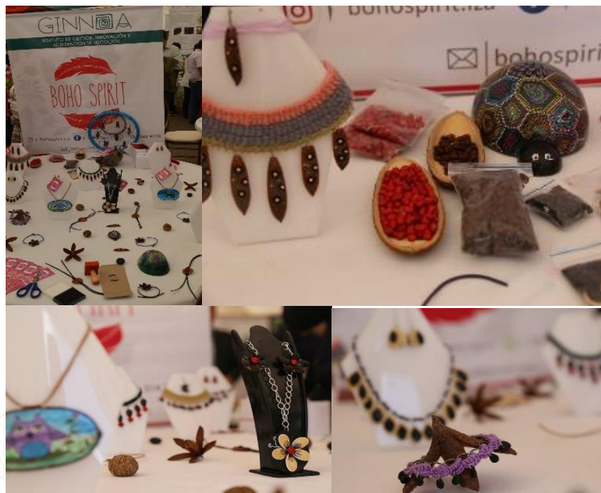
Foto: Tunja, 22 de noviembre de 2019. Resultado final del proyecto: "Bisutería con semillas naturales". Departamento de Comunicaciones UPTC. En las instalaciones del Primer Workshop de Innovación para el Desarrollo Local.

Producto: Se van aprovechar estas fibras y las mismas no serán desechadas, siendo así un producto sustentable y amigable con el medio ambiente, lo que permitirá que las joyas producidas sean personalizadas.